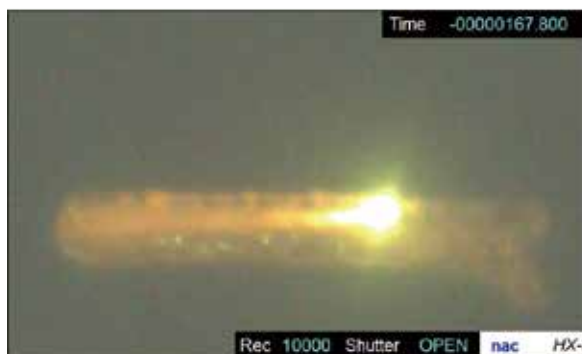
電子ビームによる金属粉末の溶融池形成

本プロジェクトの個々の研究成果を有機的に連携・統合させることにより、世界の金属3Dプリンティング・積層造形技術研究の一大研究拠点に相応しい研究プロジェクトとなります。