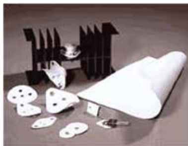
応用分野: 超高熱伝導ハイブリッド高分子