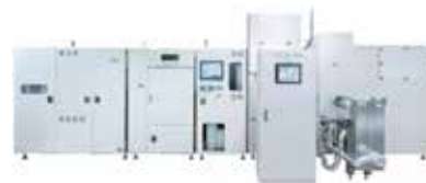
開発した超臨界水熱合成装置(10t/年)

☎ 022-795-4875 🌐 http://www.wpi-aimr.tohoku.ac.jp/ajiri_lab/